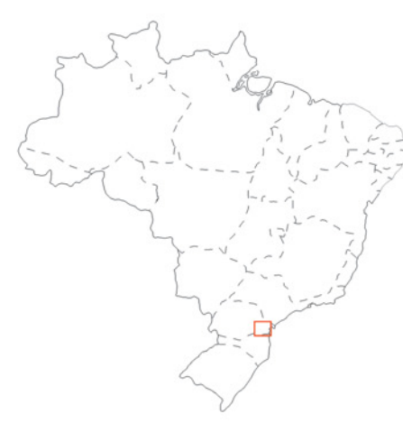
LOCALIZAÇÃO DA CARTA

Projeção Universal Transversa de Mercator (UTM) Meridiano Central (MC) : 51° Wgr. = Fuso 22